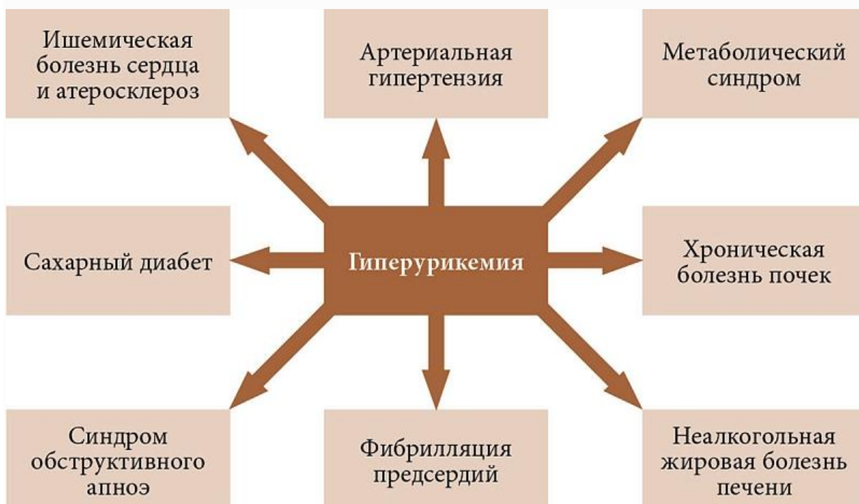
Рис. 1. Связь гиперурикемии с коморбидными состояниями

Несмотря на имеющиеся данные о механизмах развития и факторах риска ГУ и подагры, терапия этих состояний не всегда успешна. Одной из причин является высокая частота коморбидных состояний, наиболее значимым из которых признана патология сердечно-сосудистой системы и почек (рис. 1) [12–24].